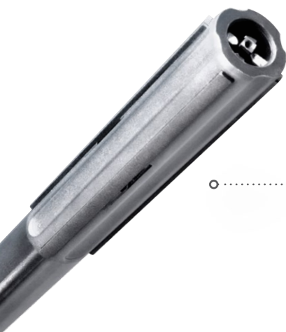
○ Herramientas MMT, LFT-DX Rango de uso \varnothing 4 – 19 mm